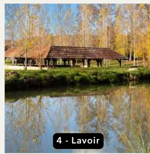
4 - Lavoir