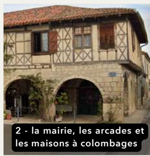
2 - la mairie, les arcades et les maisons à colombages