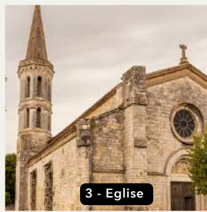
3 - Eglise