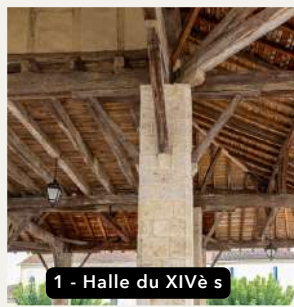
1 - Halle du XIV e s