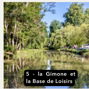
5 - la Gimone et la Base de Loisirs